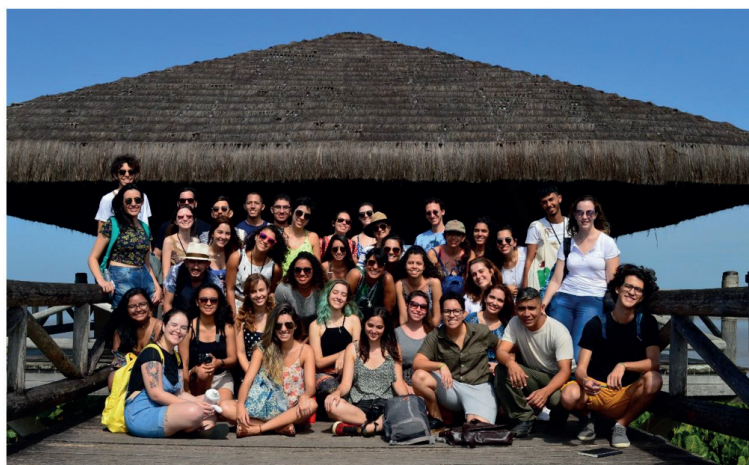
Figura 2. Estudantes Participantes da viagem no Mangal das Garças. Belém/PA, agosto de 2017.