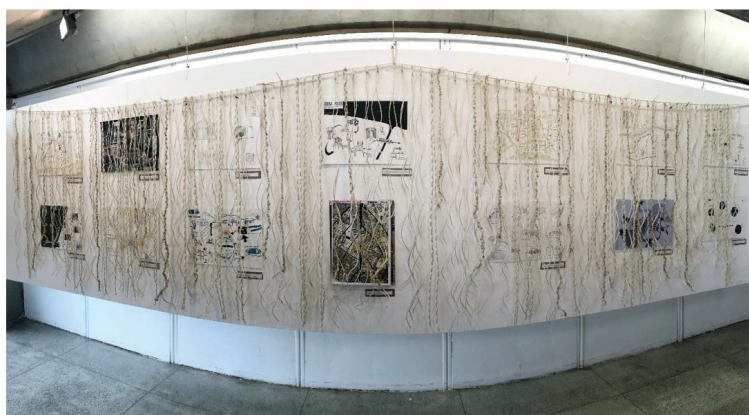
Figura 3. Painel “Deriva Urbana”.

O painel “Deriva Urbana” advém de uma atividade realizada em grupos pequenos de estudantes, no Campus da Universidade Federal do Pará – UFPA que teve como produto um mapa de percepções sensoriais. Estes trabalhos foram expostos em um painel que buscou remeter à floresta amazônica formando uma cortina que instigava o visitante a explorar para revelar os mapas.(Figura 3).