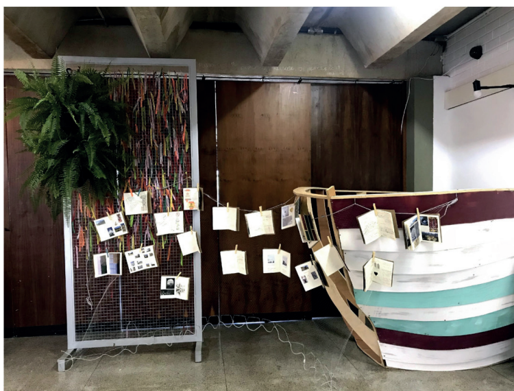
Figura 6. Diários de viagem na Expo Belém.

Os diários de viagem, ou seja, as cartilhas que cada participante recebe e insere suas observações pessoais, desenhos e outras lembranças da viagem, também apresentaram resultados singulares. Estes também permitem ampla liberdade de apresentação, o que nos mostrou a diversidade de formas de organização e apresentação de material de pesquisa pelos estudantes de Arquitetura e Urbanismo. Eles foram expostos numa rede de pesca presa em um barco cenográfico, representado a presença do rio Guamá na paisagem da cidade de Belém (Figura 6).