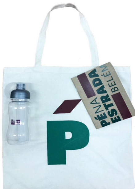
Figura 1. Material produzido pela Equipe Pé na Estrada.

A cartilha foi elaborada pela Equipe Pé na Estrada utilizando o roteiro final, mapas, textos de referência e imagens sobre os principais pontos que seriam visitados. Incluiu-se páginas em branco ao final para que os alunos pudessem registrar suas impressões da cidade por meio de desenhos, croquis, anotações, entrevistas, montagens, fotos, entre outros, constituindo assim um diário de viagem.