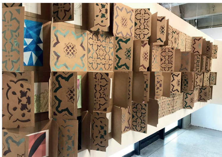
Figura 4. Painel “Natureza e Abstração”.

O painel “Escala Pantone” trouxe registros fotográficos do Centro Histórico de Belém em conjunto com uma paleta de cor com os seus respectivos códigos no sistema de padronização PANTONE, nos apresentando as diferentes escalas cromáticas da cidade. Esta atividade buscou renovar as discussões acerca da percepção sensorial e emotiva da cidade através de suas cores e materialidade, que muitas vezes iam contra o senso comum sobre Belém. As fotos foram dispostas alternadamente com espelhos mostrando o contraste com a cidade contemporânea descrita sobretudo por edifícios em altura espelhados.(Figura 5)